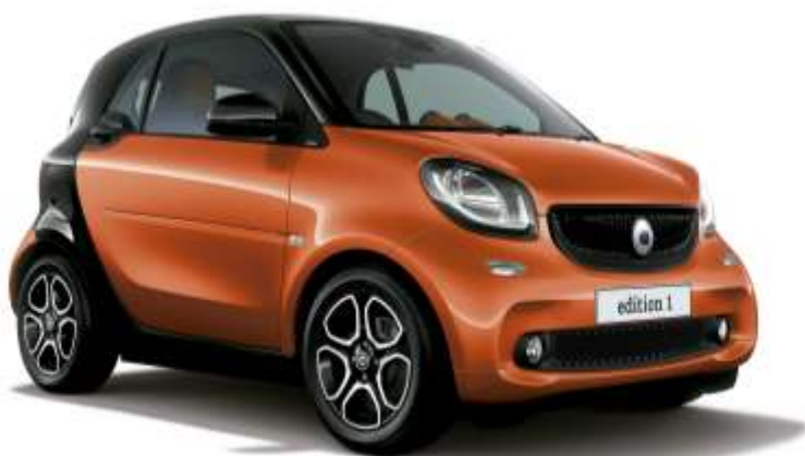
smart fortwo edition1 lava orange